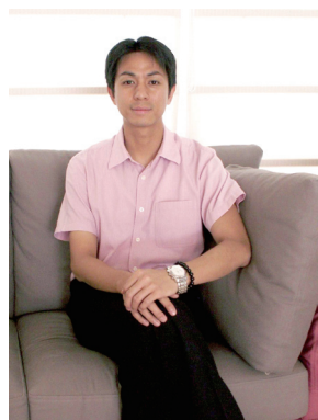
▲ 陳老師表示，採用HP智選打印管理方案後，雙面打印量已上升至約70%，讓他們能節約大量用紙。