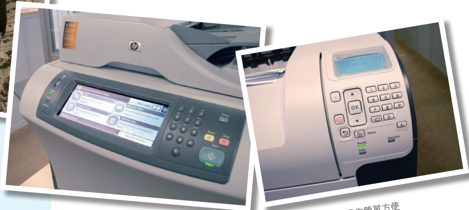
▲ HP 鐳射打印機操作簡單方便